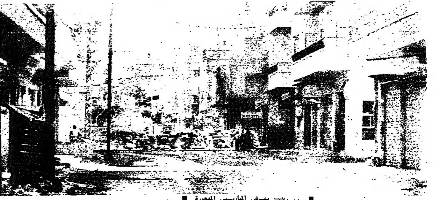
■ ريسب بعض المارسيس المهجورة ■